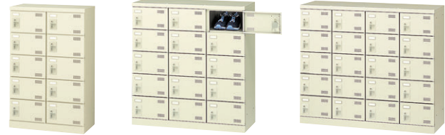
⑦ SLB-M10-S2 ⑧ SLB-M15-S2 ⑨ SLB-M420-S2

■錠バリエーション ご希望により受注生産にてお好みの錠を取付けいたします。詳しくは担当者におたずねください。