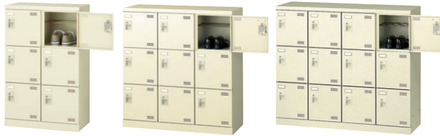
① SLB-M6-S2 ② SLB-M9-S2 ③ SLB-M412-S2