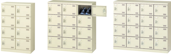
④ SLB-M8-S2 ⑤ SLB-M12-S2 ⑥ SLB-M416-S2