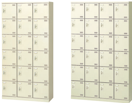
⑩ SLB-18-S2 ⑪ SLB-424-S2